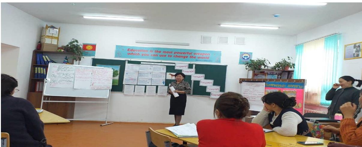
Май, 2022-ж. Мугалимдер арасында өтүлгөн семинар “Чыгармачыл болуу деген эмне?” Башталгыч класс усулдук бирикмеси