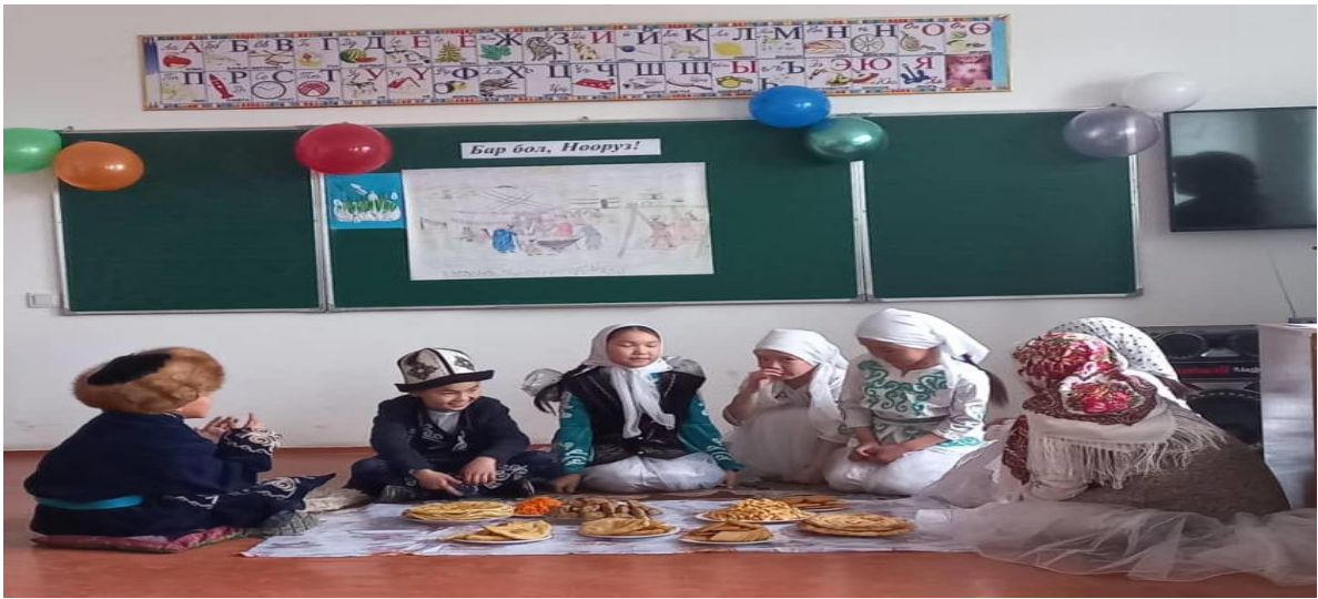
Март айы, 2022-ж. 3-класс. “Бар бол, Нооруз” Ачык тарбиялык саат. Кл.жет: Н. Үсөнбаева