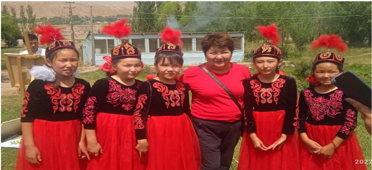
29.10.22 Райондук этно фестиваль “Керемет” бий тобу 4-класс . Кл.жет: А.Жунусова