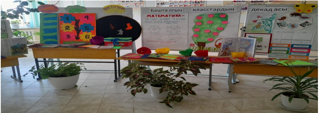
10-21.10 2022-ж Башталгыч класстардын декадасында уюштурулган көргөзмө